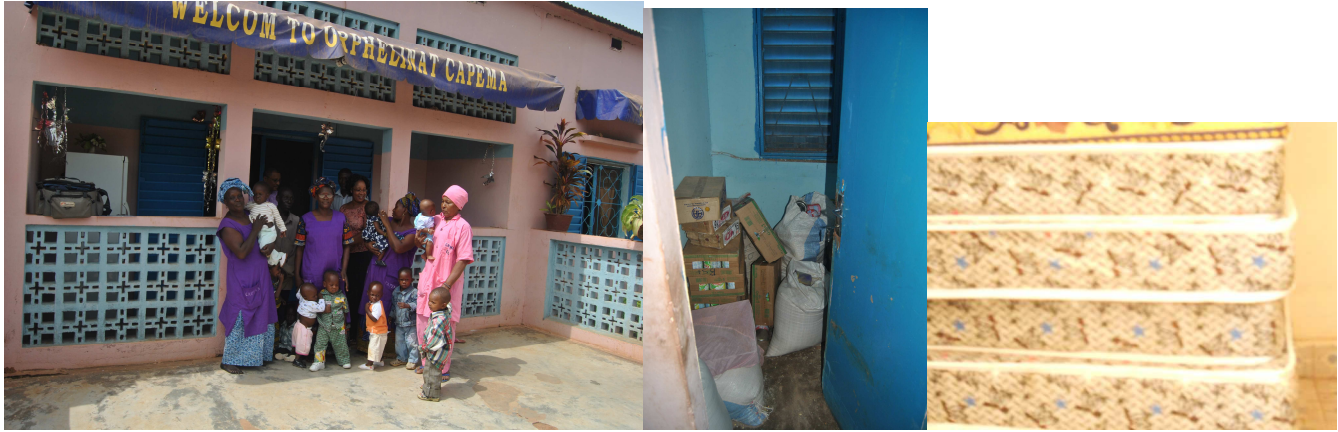
Entrata dell'orfanotrofio / alcuni degli acquisti

Latte in polvere Hero 1 y 2 e cereali per le pappe valore 345 euro