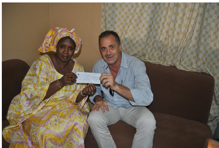
Consegna dell'assegno alla direttrice Mme Sow